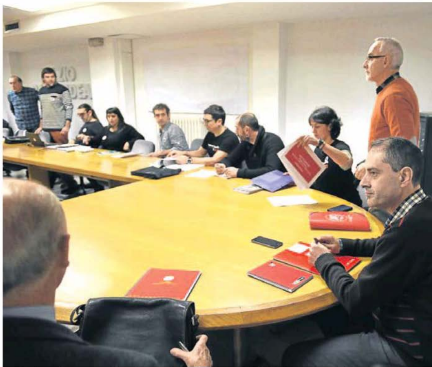
Los sindicatos han mantenido varias reuniones con Kristau Eskola sin alcanzar acuerdos.

Los responsables de los centros se dirigen también a las familias para asegurar que están haciendo «todo» lo que pueden para «llegar a un acuerdo y así resolver este conflicto que es malo para todos». «Por nuestra parte